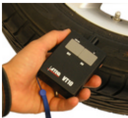
VT10 1 à 4 touches pré-réglées