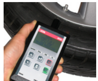
VT55 Le plus puissant