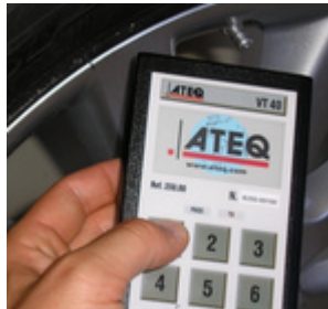
VT40 6 boutons = 6 fonctions